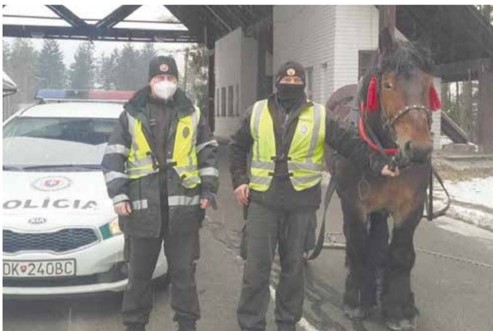
Netradičný veľkonočný pendler na slovensko-poľskej hranici.