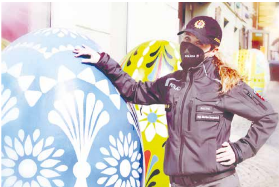
Na východe bolo vždy najlepšie, čo poviete?