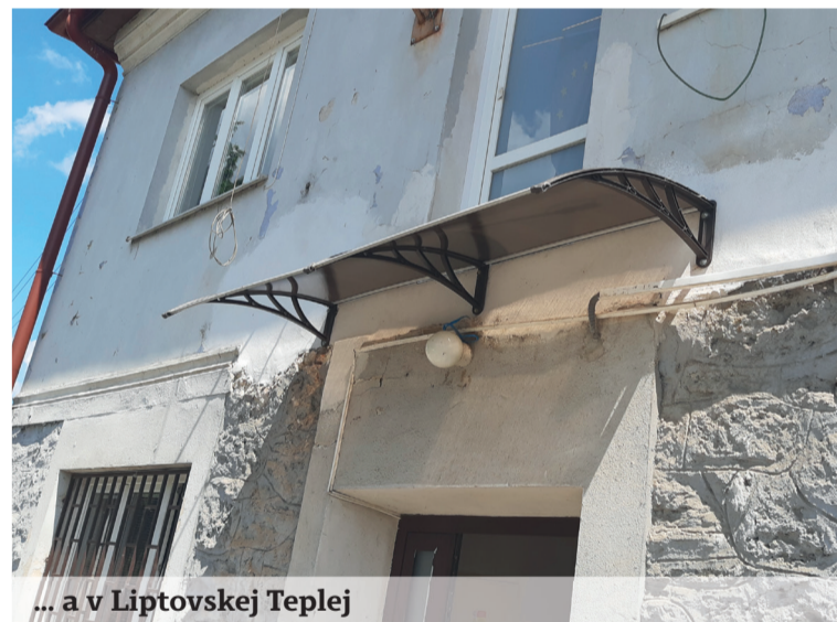
... a v Liptovskej Teplej

tvom plánu obnovy a odolnosti, vrátane obnovy historických budov, resp. pamätihodností miest, z Fondu pre vnútornú bezpečnosť a z finančných prostriedkov štátneho rozpočtu. Pri operačných programoch je MV SR viazané na vyhlásenie výzvy a následné schválenie poskytnutia nenávratného finančného príspevku, tzn. že sa k danému programu zabezpečuje vypracovanie projektových dokumentá-