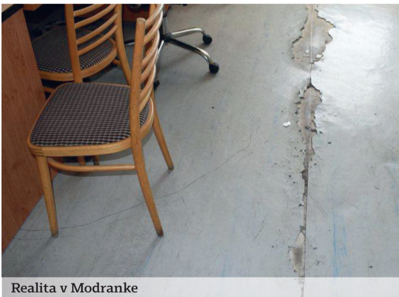
Realita v Modranke

„MV SR plánuje rekonštrukcie budov nielen z Operačného programu Kvalita životného prostredia, ale aj prostrední-