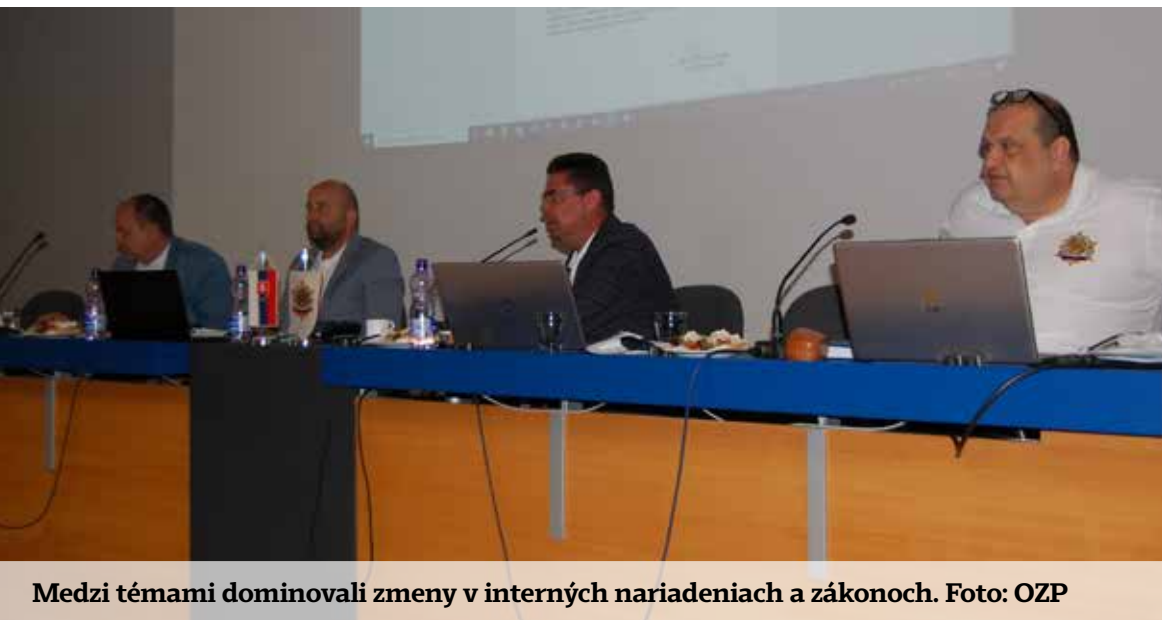
Medzi témami dominovali zmeny v interných nariadeniach a zákonoch.

Posledná Rada predsedov schválila udelenie celkovo 23 medailí OZP v SR I., II. a III. stupňa, ako aj 20 ďakovných listov. Vedenie odborov si je vedomé, že s výrobou posledných plakiét došlo zo strany dodávateľa/výrobcu k výraznému meškaniu z dôvodu absencie niektorých výrobných prvkov, avšak tento stav by už mal byť v súčasnosti napravený.