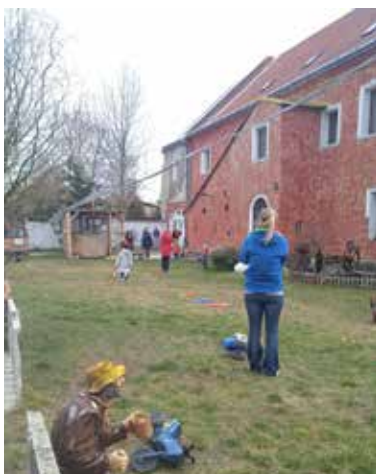
Takto žijú utečenci na ranči pri Trnave.

Všetkým, ktorí sa rozhodli pomôcť, patrí naše úprimné poďa-