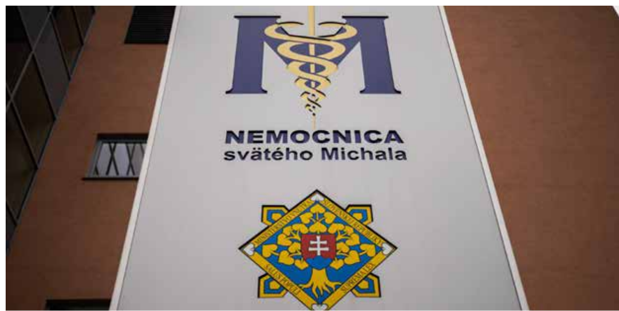
Univerzitná nemocnica - Nemocnica sv. Michala rozšírila svoje služby.

„Vytvorením jedného centra pre silové zložky bude nemocnica transparentnejšie naplňať účel svojho zriadenia a zároveň efektívnejšie služby poskytované civilným pacientom tým, že istú časť špecializovaných ambulancií mimo centra odbremeni od rezortných pacientov. Skvalitní sa tak zdravotná starostlivosť