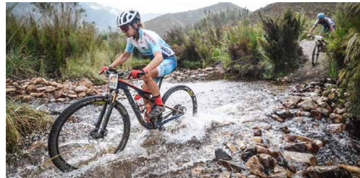
Momentka z pretekoch v Južnej Afrike.

dení som odletela do Afriky, kde sme odleteli skôr aby sme si zvykli na iné počasie, nakoľko tam v tom