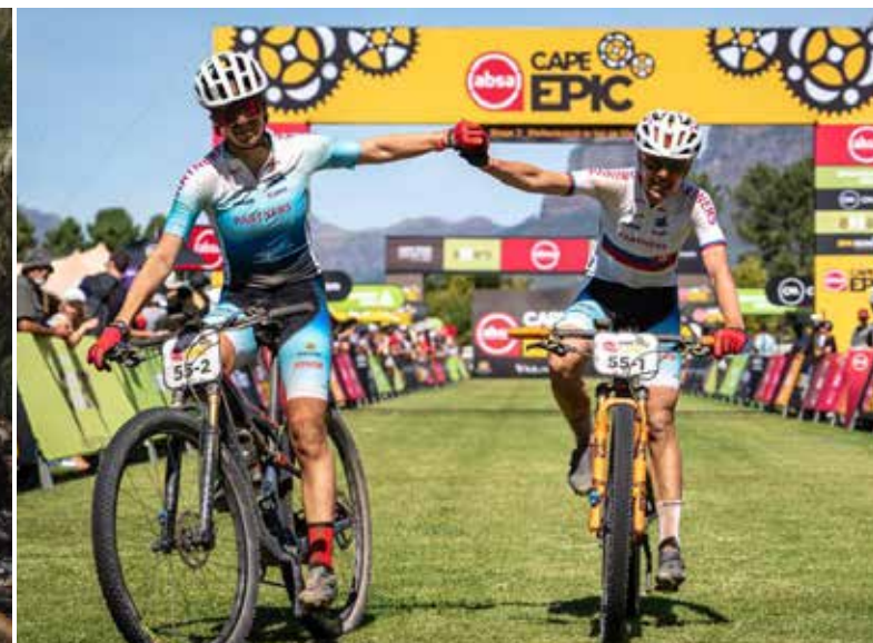
Úspešný príchod do cieľa.

v Rimavskej Sobote. „Každý deň som v úzkom kontakte s ľuďmi vo vypätých situáciách, pri ktorých sa treba vedieť hneď rozhodovať a regulovať vypäté situácie. Pri pretekoch je to podobne, tiež občas narazím na súperku ktorá je počas preteku agresívna a vulgárna a práve pri takých situáciách sa snažím využiť čas a hlavne chuť bicyklovať. Ďalším kľúčom