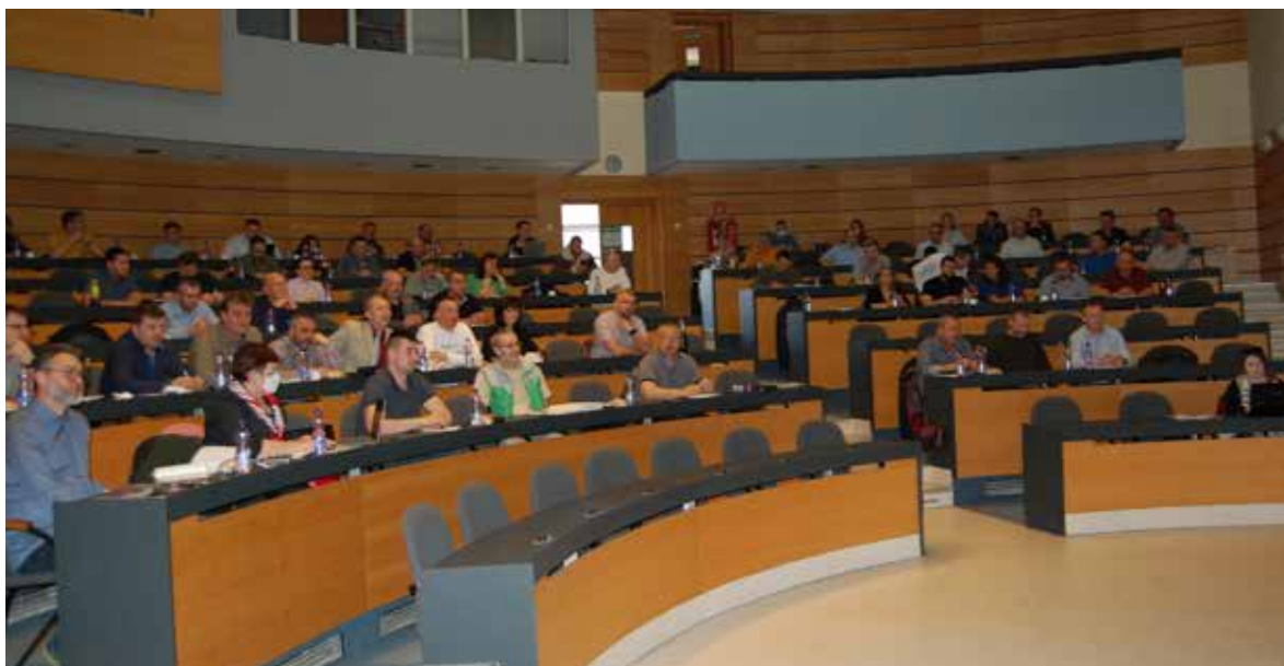
Rada predsedov priniesla pohľad na aktuálne dianie v OZP v SR.

Rovnaká nespokojnosť stále pretrváva nad nariadením o kariérom raste. Predseda OZP v SR vyzval krajských predsedov, aby prišli s vlastnými návrhmi, ako je aktuálne platné nariadenie mož-