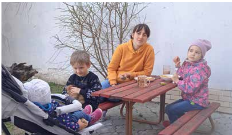
Spokojné ukrajinské rodiny aj vďaka pomoci od odborárov.

Odborári hneď z troch základných organizácií Odborového zväzu polície v SR nedávno zabezpečili nákup kozmetiky, čistiacich prostriedkov, kuchynských potrieb a ďalších vecí každodennej potreby v hodnote takmer 500 eur pre rodiny, ktoré ušli pred vojnou na Ukrajinu. Nebola to zďaleka ich posledná aktivita v tomto smere, pričom ďalší kolegovia predstavili knihu na pomoc Ukrajincov.