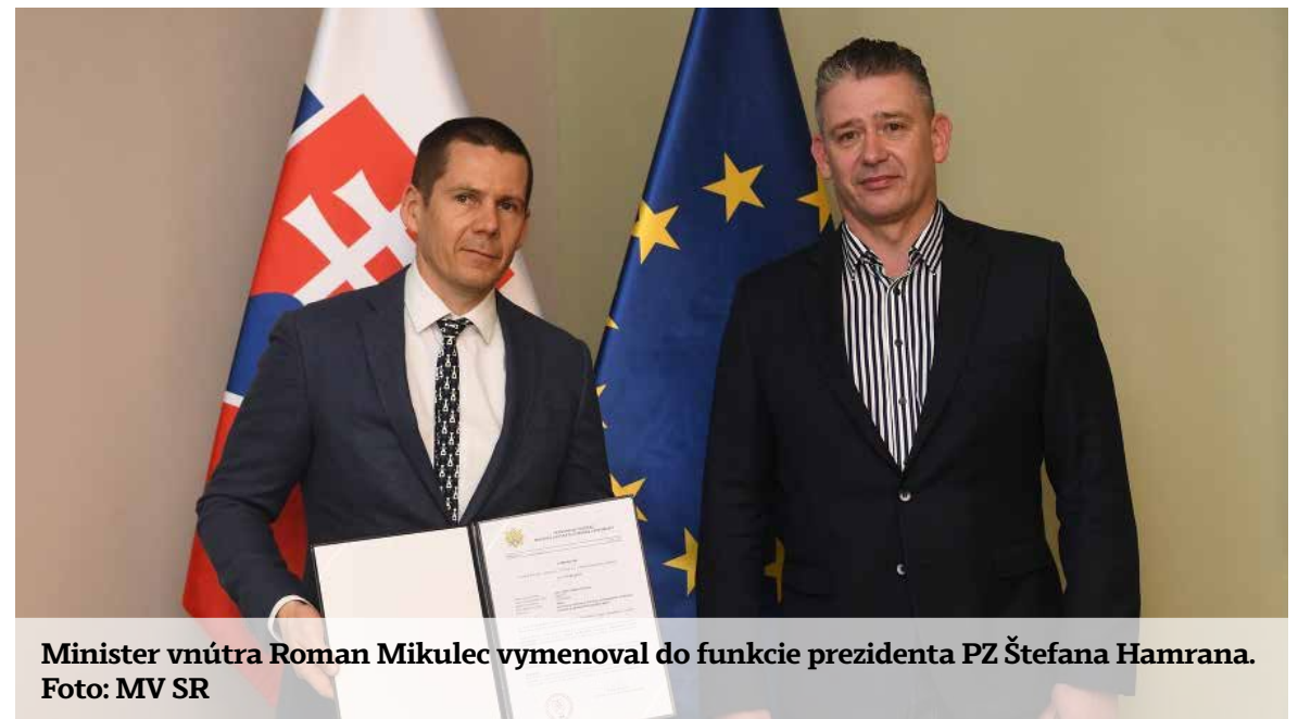
Minister vnútra Roman Mikulec vymenoval do funkcie prezidenta PZ Štefana Hamrana.

Teraz už po vymenovaní nového prezidenta sa očakáva naštartovanie dlho pripravovanej reformy, ktorá by sa mala z prezidiálnych štruktúr preniesť do regiónov. Hovorí sa o formáte štyroch krajských riaditeľstiev, súčasný počet v podobe čísla osem