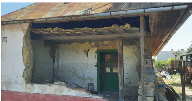
Smutný pohľad na miesto práce policajtov a jeho bezprostredné okolie v okrese Komárno, zdroj: B. Balogh