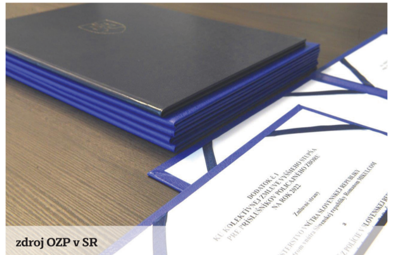
zdroj OZP v SR