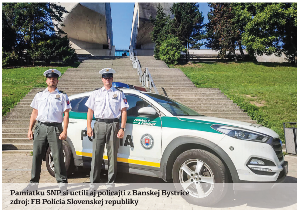
Pamiatku SNP si uctili aj policajti z Banskej Bystrice