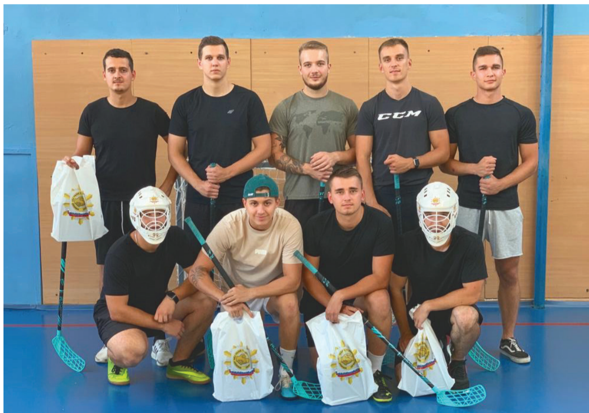
Budúci mladí nádejní policajti po florbalovom zápase

v SR sa teší z vydarenej akcie a určite podporí podobné aktivity aj v budúcom roku. B. Balogh