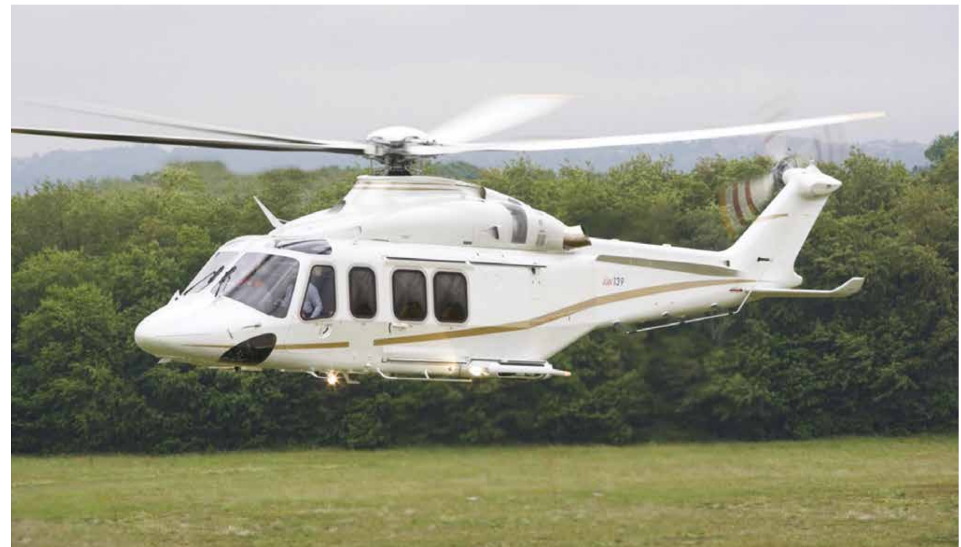
Nákup vrtuľníkov prešetrí Úrad pre verejné obstarávanie.

Hovorkyňa ÚVO uviedla, že úradu boli doručené námietky od účastníkov konania. Ministerstvo vnútra v reakcii uviedlo, že odmieta snahu o spochybňovanie procesov a deklaruje súčinnosť s ÚVO.