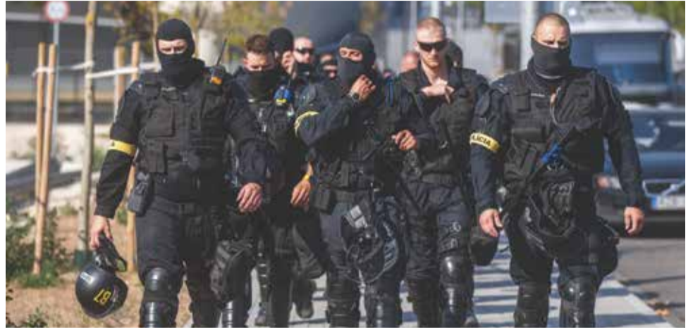
Policajti z viacerých krajských riaditeľstiev sa podieľali na dohliadaní poriadku na futbalovom zápase v Budapešti, kde sa predstavil ŠK Slovan. Išlo o unikátnu spoluprácu s maďarskými kolegami.