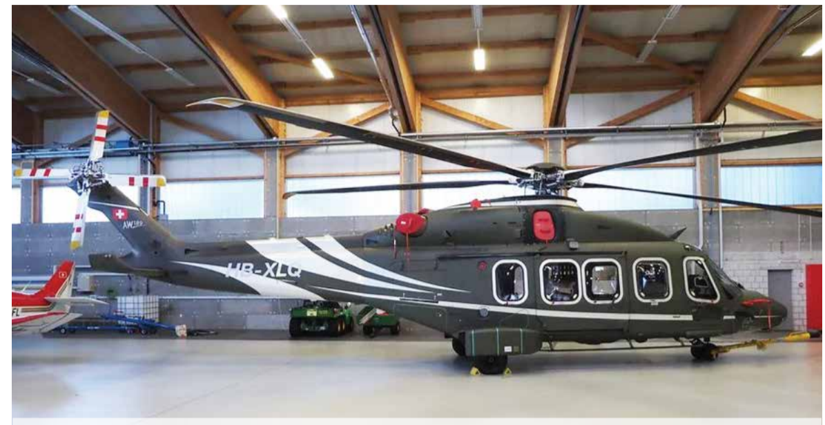
Jeden z dvoch nových typov vrtuľníkov, ktoré chce rezort vnútra kúpiť.

Ako si všimli médiá, nákup dvoch vrtuľníkov v hodnote 28 miliónov eur sa z uvedených dôvodov potreby rýchleho nákupu bude realizovať priamym rokovacím konaním, teda nie verejnou súťažou, ani inou obdobnou formou.