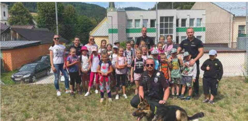
Preventívne aktivity a návštevy policajtov sú obľúbeným spestrením letných táborov. Nie je tomu inak ani toto leto.