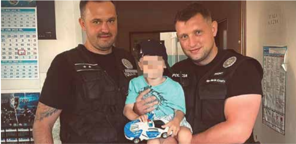
Policajti z Vrábels zachránili iba troj ročného chlapca, ktorý sa nahý pohyboval po frekventovanej ceste. Jeho mama bola pod vplyvom alkoholu. Prípacom sa už zaoberá sociálny úrad.