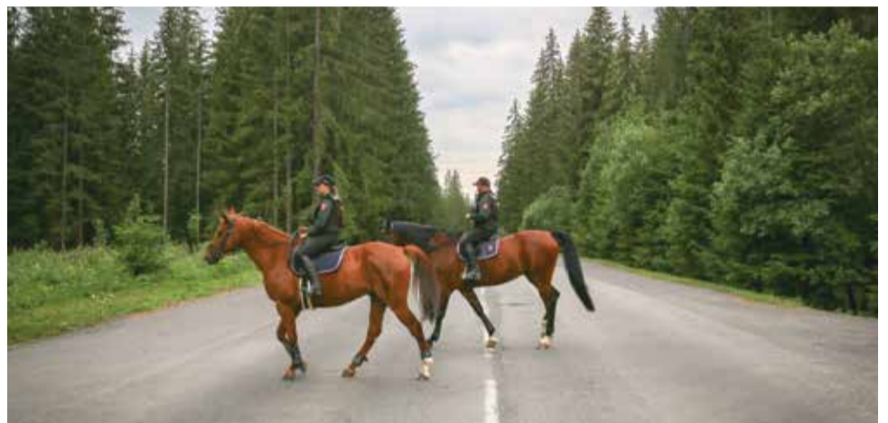
Oddelenia hipológie v Bratislave a Košiciach sa v turnusoch pohybujú v peknom prostredí Vysokých Tatier, kde preventívnou činnosťou odrádzajú kriminálnikov od ich plánov.