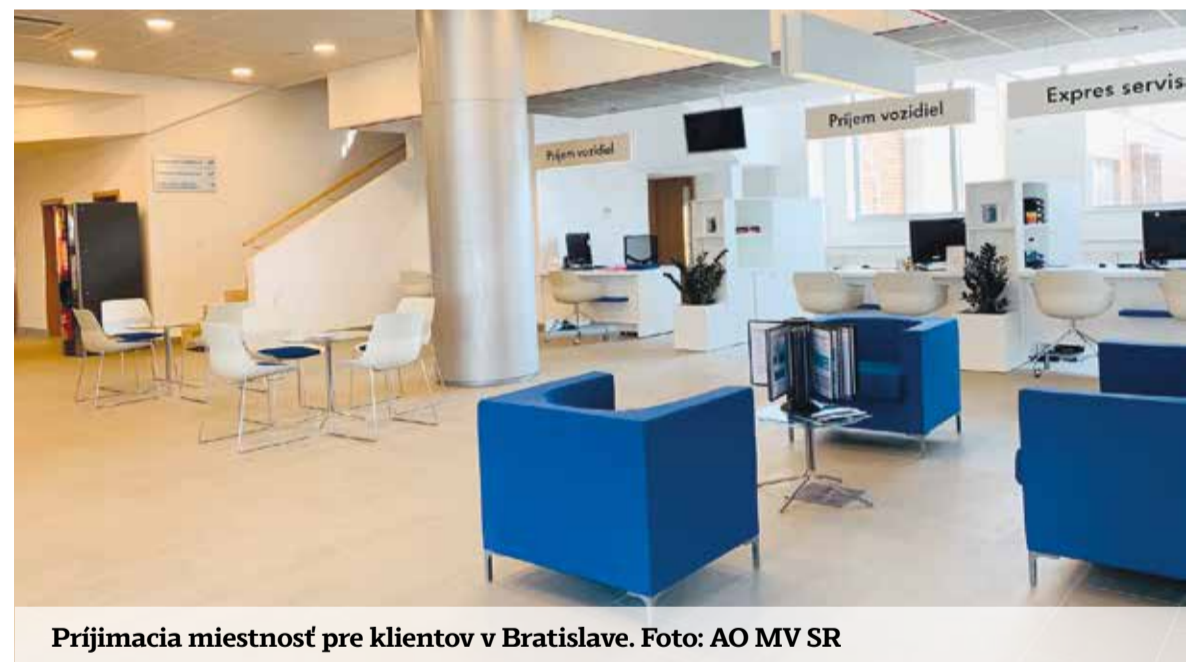
Prijímacia miestnosť pre klientov v Bratislave.

Tu by som však rád zdôraznil, že vždy keď máme možnosť a naše výsledky nám to umožňujú, snažíme sa vyhovieť resp. vždy nájsť zlatú strednú cestu. Som veľmi rád, že doterajšie výsledky našej práce, aj napriek zložitejšej situácii, čo sa pandémie týka, nám opäť umožnili zlepšiť sociálne benefity pre našich zamestnancov. Míňny rok sa nám podarilo vyplatiť zamestnancom 13. a 14. plat a tento rok opäť zvýšiť základné mzdy zamestnancov, zvýšiť finančný príspevok na stravovanie a zvýšiť príspevok do DDS.