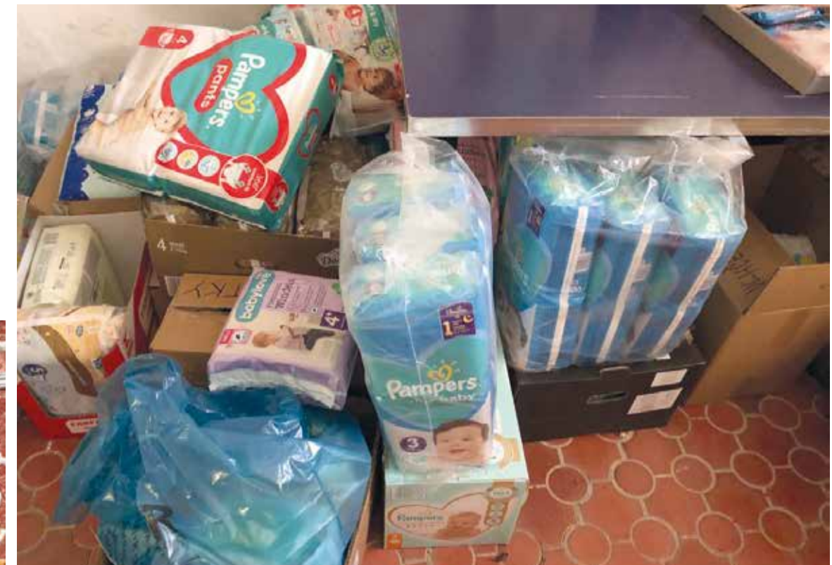
Pomoc od bratislavských odborárov pre utečencov z Ukrajiny.

Darované veci ľudí v núdzi nepochybne potešili, keďže ranč nebol stavaný na nepretržité ubytovanie toľkých ľudí a akákoľvek pomoc je viac ako