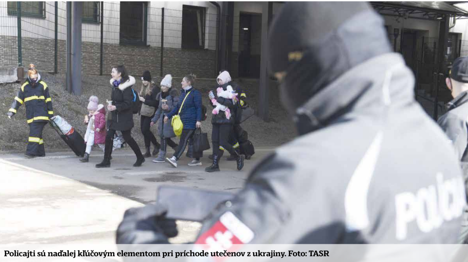
Policajti sú naďalej kľúčovým elementom pri príchode utečencov z ukrajiny.

Ak niekto očakával, že sa vojna na Ukrajine skončí v priebehu pár dní s takým, či onakým výsledkom, musel sa prerátať. Od momentu prvého napadnutia k nám deň a nocou aj v týchto chvíľach prúdia tisíce utečencov denne. V maximálnom nasadení je viac ako tisíc policajtov v regiónoch, ale aj na oddeľeniach cudzineckej polície. Posily predstavujú tiež kadeti z Akadémie Policajného zboru a študenti Stredných odborných škôl z Pezinka a Košíc.