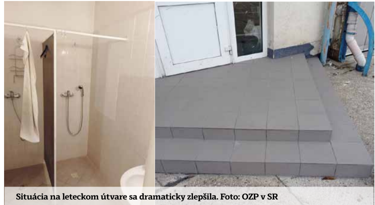
Situácia na leteckom útvere sa dramaticky zlepšila.

Počas základnej kontroly sme mali možnosť priamo vyskúšať, aké podmienky mali piloti a ostatný personál v čase vonkajších teplôt okolo 33 stupňov, keď na pracovisku sa teplota pohybovala v ešte väčších stupňoch. Preto nás pri následnej kontrole potešilo, že v budove bolo namontovaných viacerých klimatizačných jednotiek. Zlepšenie nastalo aj v obnovení toaliet a spích. Zabezpečená bola nová kuchynka. Je možné konštatovať, že celkovo bola odstránená väčšina zistených nedostatkov.