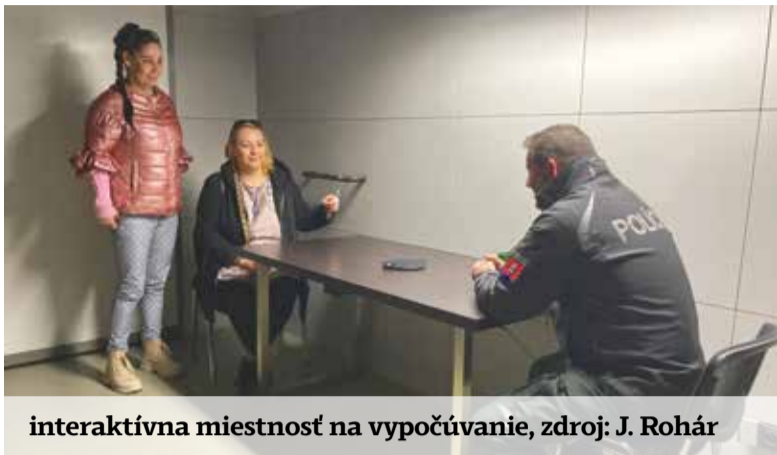
interaktívna miestnosť na vypočúvanie

pečná droga a čím skôr dieťa začne piť, tým je väčšia pravdepodobnosť, že prepadne závislosti. Podľa A. Smoleňákovvej v súčasnosti práve v časoch krízy, pandémie či vojny, mladí ľudia stále viac siahajú k alkoholu, ale aj drogám, aby si pomohli a na čas sa zbavili negatívnych informácií. Práve preto majú preventívne akcie ako Revolution train zmysel. Protidrogový vlak strávil v Pezinku jeden deň. Po odchode z Pezinka navštívil aj hlavné mesto Bratislavu, kde sa obdobné podujatie konalo pod