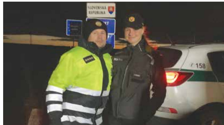
Česko-slovenská policajná spolupráca funguje

Okres Skalica patrí medzi najmenšie policajné okresy, no z hľadiska migračnej krízy je kľúčový, nakoľko ním prechádza hlavný migračný koridor. Nachádzajú sa tu viaceré hraničné priechody, vrátane najväčšieho na diaľnici D2. Navyše na medzinárodnej ceste I/51 na hraničnom priechode Holíč - Hodonín funguje „Spoločné kontaktné pracovisko“, ktoré zabezpečuje readmisie osôb, teda na tomto hraničnom priechode česká strana vracia zachytených nelegálnych migrantov späť na Slovensko. Zlomovým momentom z hľadiska prístupu Slovenska k migračnej kríze bolo