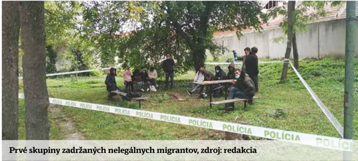
Prvé skupiny zadržaných nelegálnych migrantov, zdroj: redakcia

Počas našej návštevy bola v Brodskom prítomná aj jednot-