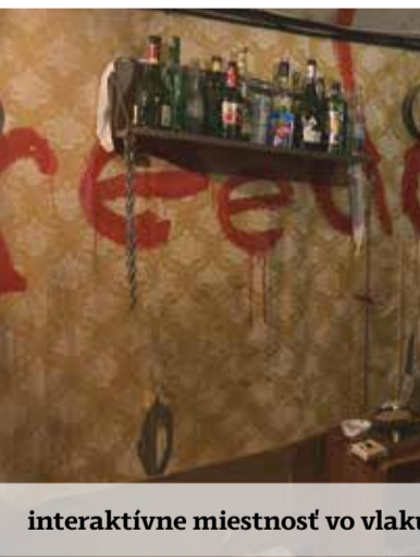
interaktívne miestnosť vo vlaku – drogová skryš

miestnosť na vypočítavanie na policii alebo drogovú skryš. Prevenčný program Revolution train nekončí len pri vlaku. Najnovšie bol predstavený systém inovatívnych klubovní, kde sa budú deti schádzať a robiť dobré skutky. Ide o ďalší spôsob modernej zážitko-