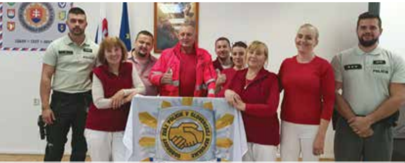
Skvelý tím zdravotníkov si rovnako zaslúži pochvalu za svoju prácu

odborári. Aj tento rok sa v utork 4.októbra premenila zasaďačka Krajského riaditeľstva Policajného zboru v Nitre na odborné miesto pre darovanie krvi. Každému policajtovi či hasičovi, ktorý prišiel darovať tú najcenejšiu tekutinu patrí veľká vďaka. Celkovo sa zúčastnil a krv prišlo darovať 22 policajtov a 4 hasiči. Aj takýmto spôsobom sa pomáhajú zachraňovať životy. Práve policajti či hasiči