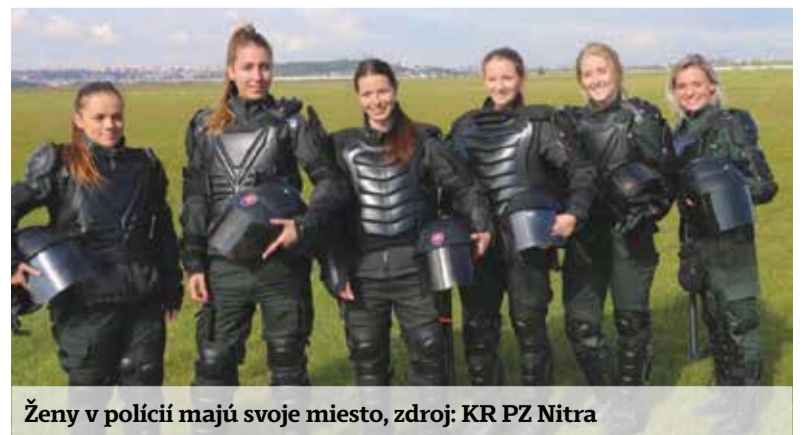
Ženy v polícii majú svoje miesto, zdroj: KR PZ Nitra