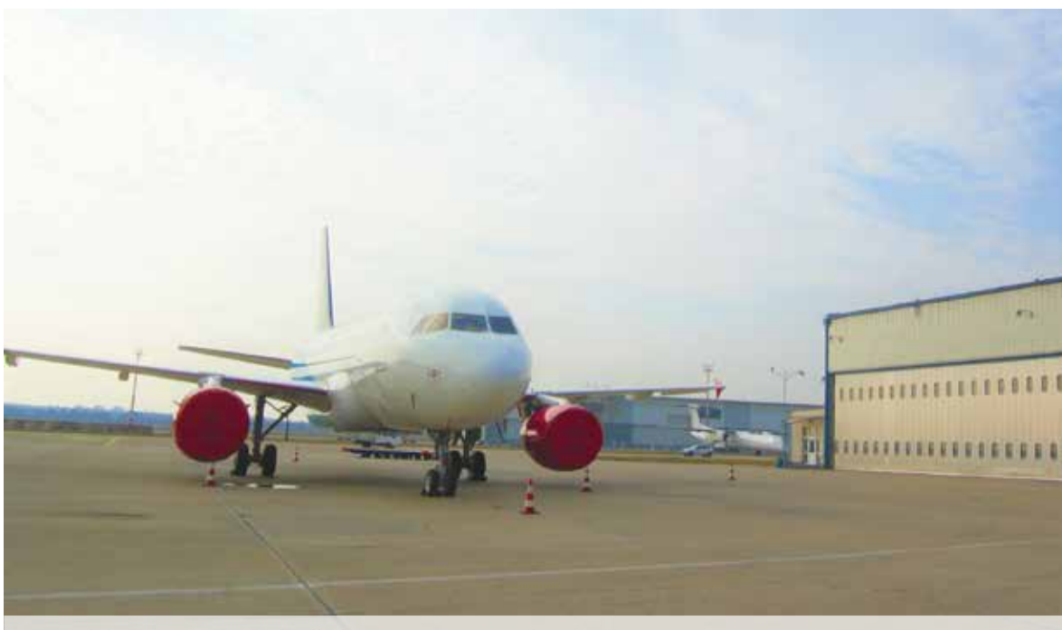
Letecký útvar MV SR, ilustračné foto, zdroj: J. Rohár