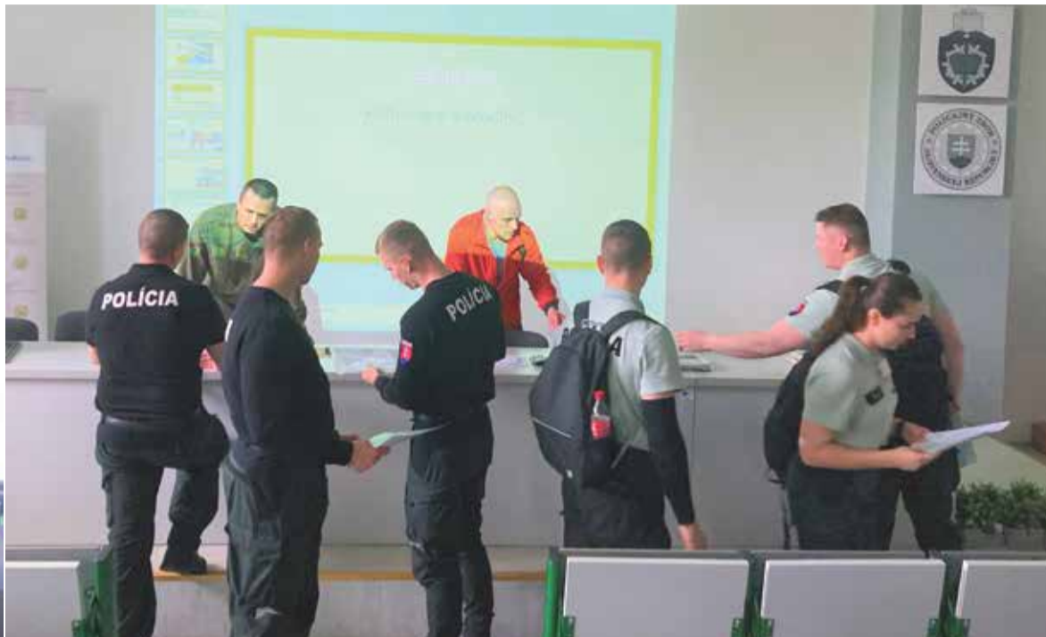
O vstup do OZP v SR bol medzi mladými policajtami záujem