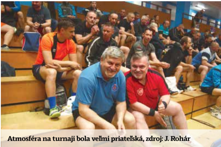
Atmosféra na turnaji bola veľmi priateľská

a XII. majstrovstvá MV SR a PZ, rovnako ako predchádzajúcich 24 ročníkov, opäť potvrdili opodstatnenosť a význam konania tohto turnaja pre aktívnych policajtov a výsluhových dôchodcov, ktorí sa stolnému tenisu venujú súťažne v kluboch registrovaných v SSTZ, ale aj rekreačných hráčov. Dovoľujeme si tvrdiť, že stolný tenis spolu s futbalom patrí medzi športy, ktorým sa venuje najviac aktívnych a bývalých policajtov. Len v kluboch v rámci SR je registrovaných niekoľko sto policajtov a občianskych zamestnancov MV SR hrájúcich dlhodobé súťaže, od extraligy až po okresné súťaže. A medzi rekreačnými hráčmi je to ešte viac. Avšak iba malá časť z nich má možnosť zúčastniť sa turnaja o PPP a majstrovstiev MV SR a PZ, ktoré sú svojím spôsobom vyvrcholením ich športových aktivít. Zároveň majú možnosť konfrontovať svoju výkonnosť, môcť sa stretnúť so svojimi kolegami