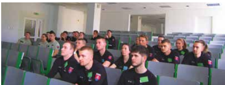
Študenti počas prednášky