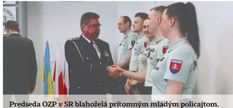
Predseda OZP v SR blahoželel prítomným mladým policajtom.

Mladá odborárka je aj úspešnou reprezentantkou v horskej cyklistike