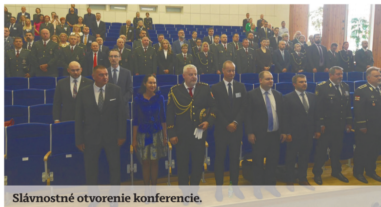
Slávnostné otvorenie konferencie.

Pri príležitosti 20. výročia členstva Slovenskej republiky v Európskej únii usporiadala Akadémia Policajného zboru v Bratislave v dňoch 21. - 22. mája 2024 vedeckú konferenciu. Nad podujatím s me-