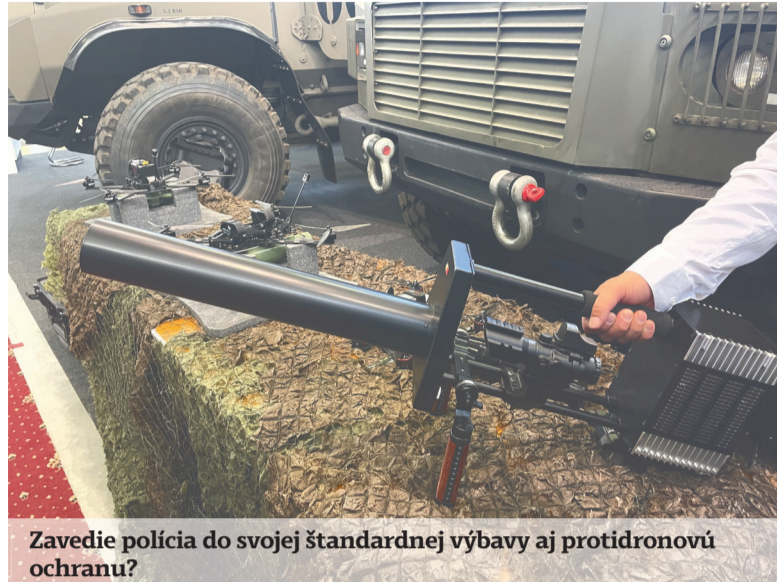
Zavedie polícia do svojej štandardnej výbavy aj protidronovú ochranu?

Podľa ministra vnútra veľtrh vytvoril príležitosť na debatu o modernizácii, najnovších technológiách a možnostiach, ako reagovať na krízové situácie, ktoré prináša 21. storočie a aktuálna