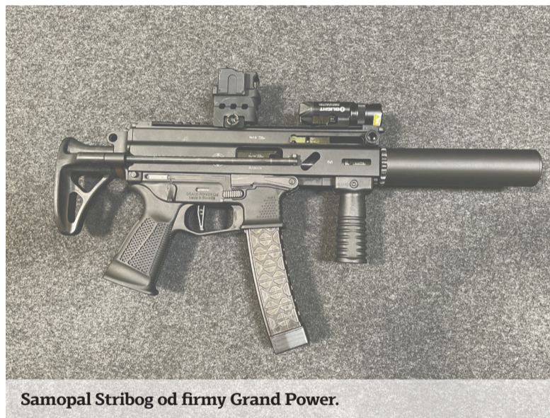
Samopal Stribog od firmy Grand Power.