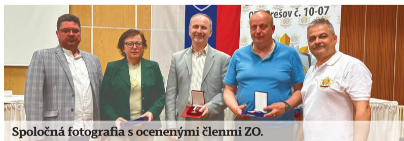
Spoločná fotografia s ocenenými členmi ZO.