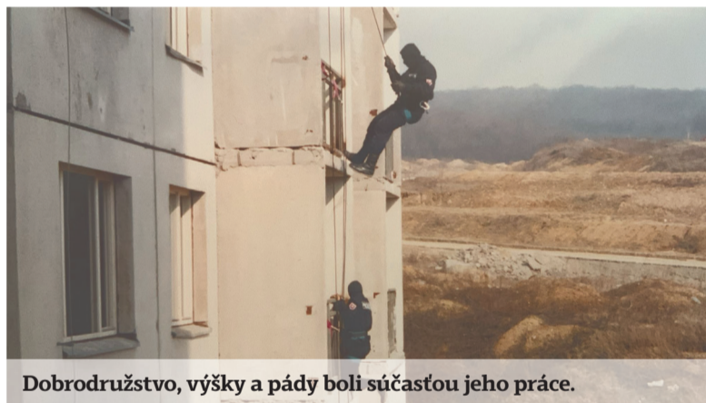
Dobrodružstvo, výšky a pády boli súčasťou jeho práce.