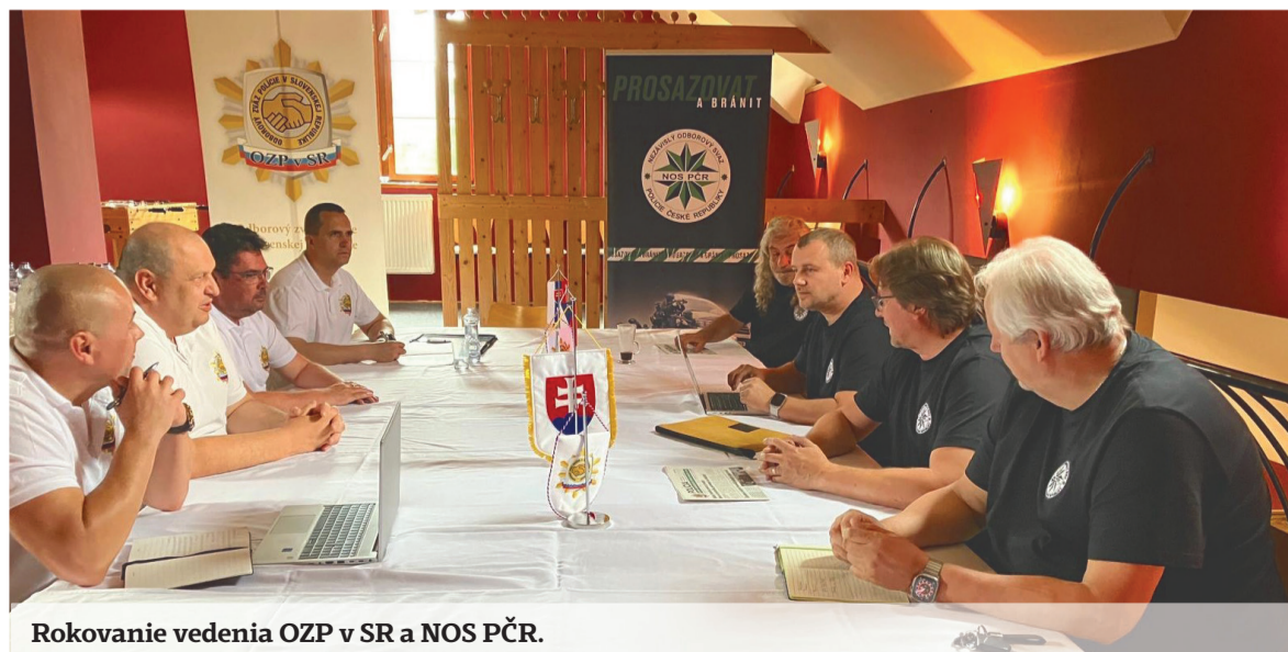
Rokovanie vedenia OZP v SR a NOS PČR.