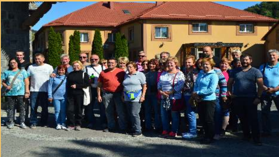
Poznávací výjazd Ukrajina Užhorod