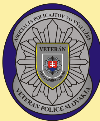
Znak APVV upravený podľa Heraldickej komise MV SR